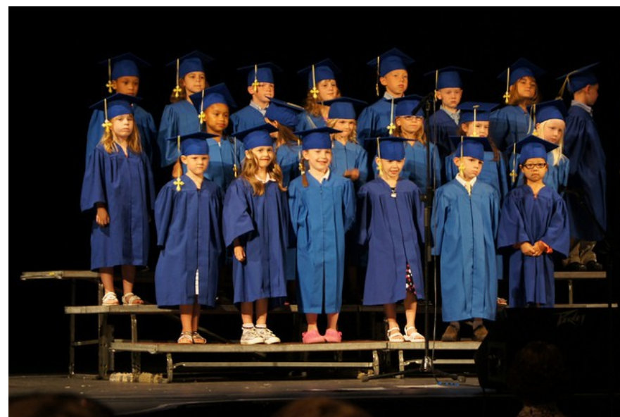
Graduation 7

Lundi 29 et mardi 30 octobre 2012, Paris